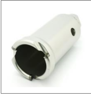
제품명 : 홀스커터3"(MP21-8-3) 규격 : 140x70x70mm 날판직경 : 70mm 회전속도 : RPM 11000 - 15400