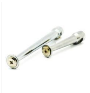
제품명 : 보조공구1(MP21-13-1) 규격 : 90x15x15mm 150x15x15mm