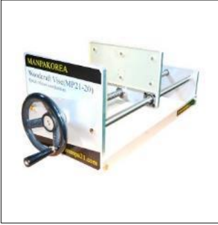
제품명 : 킷릴리즈 목바이스 (MP21-20-600/1000) 규 격 : 650x260x260mm 1000x260x260mm