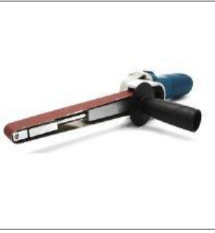
제품명 : 벨트샌더(MP21-14) 규격 : 300x160x17mm 직경 : 폭 30mm, 두께 17mm 회전속도 : RPM 11000 - 15400