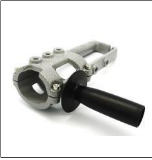
제품명 : 그라인더홀더(MP21-9) 규 격 : 280x100x70mm