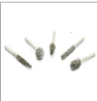
제품명 : 로타리바(MP21-21-S) 규 격 : 1/8" Shark 회전속도 : RPM MAX 25000