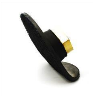
제품명 : 샌딩플렉스(MP21-19) 규격 : 2" - 50x50mm 3" - 75x75mm 4" - 100x100mm 회전속도 : RPM 5500 - 8800