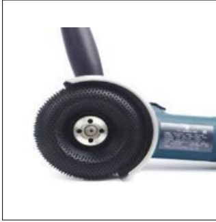
제품명 : 샌딩휠4"(MP21-17-4) 규격 : 100x100x16mm 회전속도 : RPM 11000 - 15400