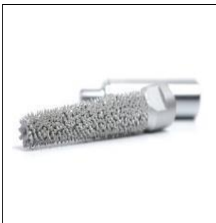
제품명 : 샌딩샤프트(MP21-18) 규격 : 10x10x100mm 회전속도 : RPM 11000 - 15400