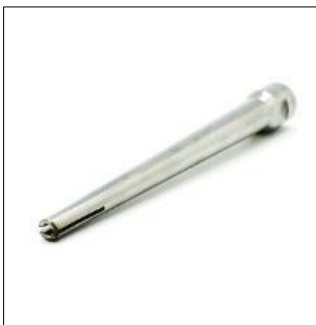
제품명 : 보조공구2(MP21-13-2) 규격 : 150x15x15mm