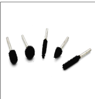
제품명 : 로타리바(MP21-21-H) 규 격 : 1/8" Shark 회전속도 : RPM MAX 25000