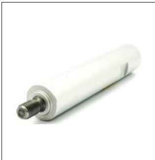
제품명 : 사포공구(MP21-12) 규격 : 140x25x25mm