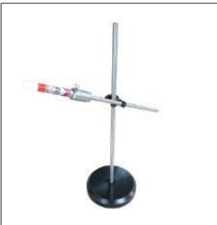
제품명 : 수평그리기(MP21-15) 규 격 : 370x160x160mm