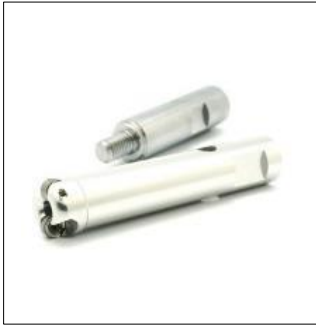
제품명 : 크랙커터(MP21-16) 규격 : 20x20x100mm 날판직경 : 20mm 회전속도 : RPM 11000 - 15400