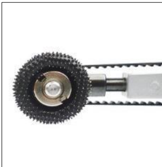
제품명 : 샌딩휠2"(MP21-17-2) 규격 : 45x45x8mm 회전속도 : RPM 11000 - 15400